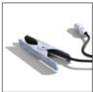
Automatische Start/ Stopp