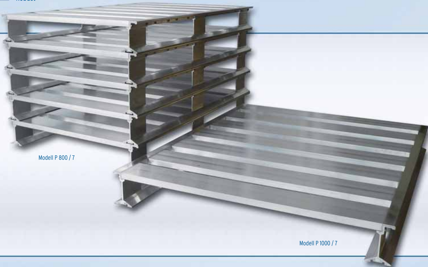
Modell P 800 / 7