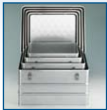
Set A 1599