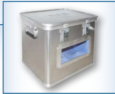
Transportkiste für den Transport von zylindrischen Trägern mit Sichtfenster und Innenschäumausstattung