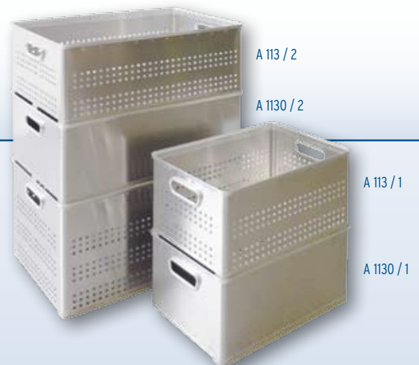
A 113 / 3