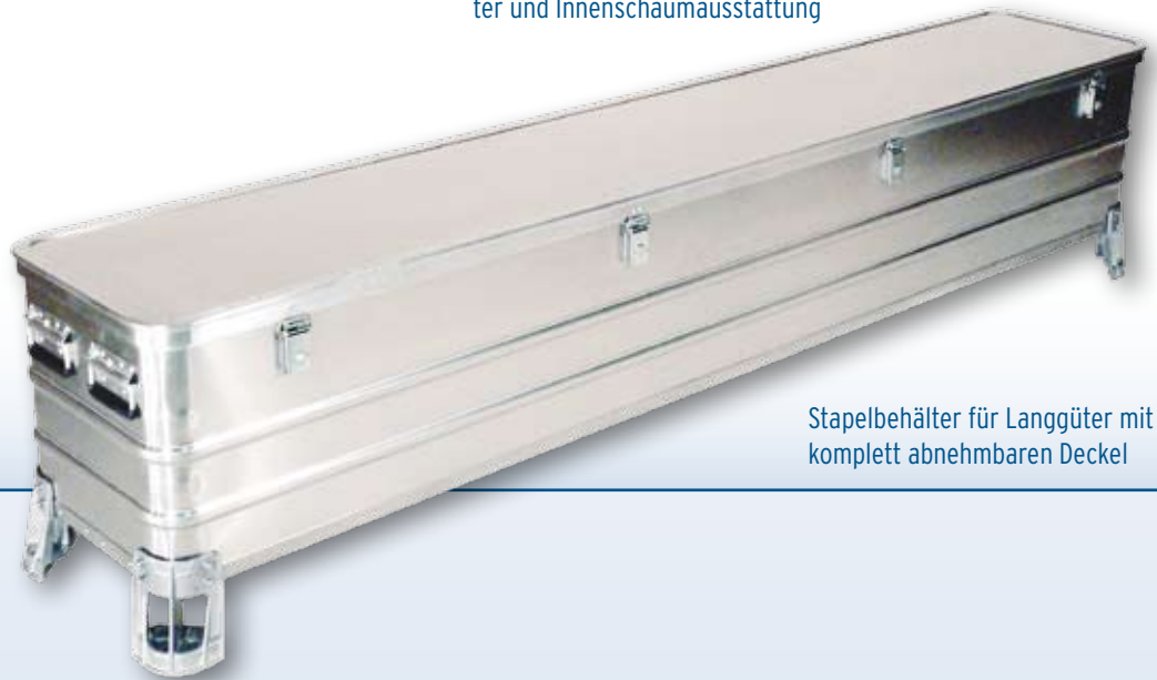
Stapelbehälter für Langgüter mit komplett abnehmbarem Deckel