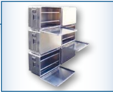
Kisten zu einem Lagerregal stapelbar