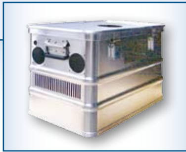
Transportkiste als Gehäuse für ein Luftbefeuchtungssystem